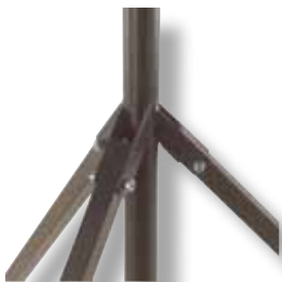
Articulation des pattes directement sur le mât principal