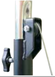
Mollette de rattrapage de jeu et mât embouti pour un guidage parfait