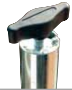
Haut du mât M10 avec molette pour fixation de la barre (BA 30) ou autres accessoires de projecteurs