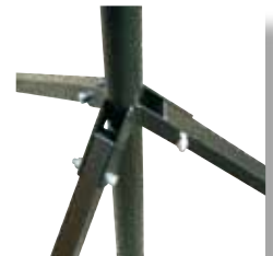
Articulation des pattes directement sur le mât principal