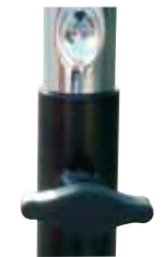
Molette de blocage du mât embouti sur le tube