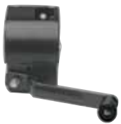
Nouveau treuil à vis sans fin anti-retour (sans bruit, sans entretien)